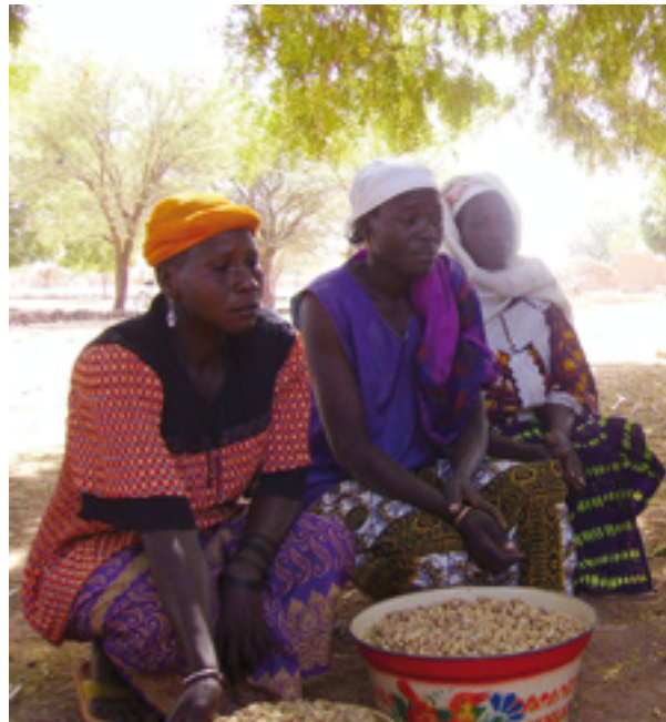
Camperoles de Burkina Faso.

Als reptes de la sostenibilitat mediambiental, social i econòmica que apuntava l'IAAASD (organisme creat per la FAO i el Banc Mundial per analitzar com el coneixement pot aplicar-se al desenvolupament) s'ha de sumar la sostenibilitat humana, segons la qual tota la societat es fa càrrec de la cura que implica el manteniment de l'espècie: "La SbA recontextualitza i dóna valor a moltes lluites feministes i planteja la urgència d'una agenda política al voltant dels treballs reproductius, que inclouen els treballs de processament d'aliments, i de cura, però no com una cosa exclusiva de les dones sinó com un assumpte de tothom" 1