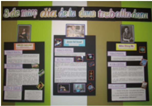
Exposició sobre dones científiques a l'EBM Somriures.

de l'escola s'han de posar mesures perquè el joc eviti la competitivitat cruenta, no fomenti l'agressivitat i faciliti les relacions entre nenes i nens.