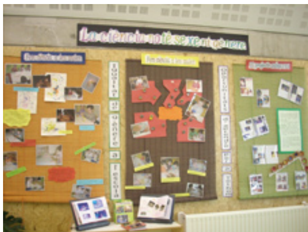
Exposició sobre dones científiques a l'EBM Somriures.

Malgrat que les noies obtenen millors notes que els nois a primària i secundària, aquests resultats no es corresponen amb l'èxit professional a causa de la desigualtat d'oportunitats. El seu futur es veu condicionat moltes vegades per les idees prèvies d'una part del professorat, al considerar que les carreres tècniques i científiques són més apropiades per al sexe masculí. Però és en els estudis de formació professional on es dona més diferència en la presència dels dos sexes. Les noies no s'encarriren per aquest camí perquè l'orientació del estudi no es realitza fins a l'adolescència i, encara que l'elecció no està feta, la personalitat de base ja està marcada i els estereotips assumits.