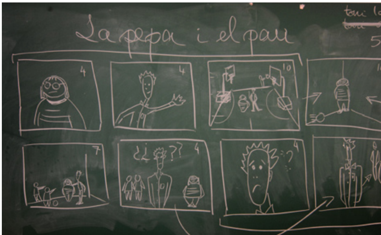
Exposició sobre dones científiques a l'EBM Somriures.