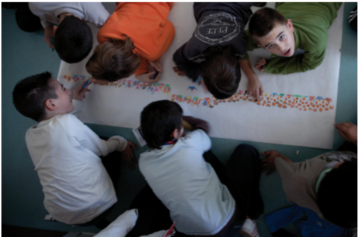
Exposició sobre dones científiques a l'EBM Somriures.

En l'àmbit del joc escolar, els patis són una representació en miniatura de la nostra societat, on els infants reproduïxen la competitivitat, l'agressivitat i el sexisme que els envolta. La utilització de l'espai és desigual i separada per sexe. Mentre ells juguen a futbol i ocupen la major part de l'espai, elles se'n reserven un lloc reduït per a saltar a la corda. Des