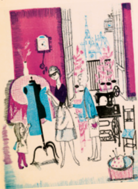
Formación Político social. Primer curso de bachillerato. Madrid, 1962

Dentro de la familia, la mujer merece todos los honores por el amor del hombre. Pero ¿por qué merece este amor por su belleza? ¿Solo por su delicadeza? Mucho más que eso merece el su "abnegada maternal", por enorme que sea, realizando el gobernando el hogar donde convive.