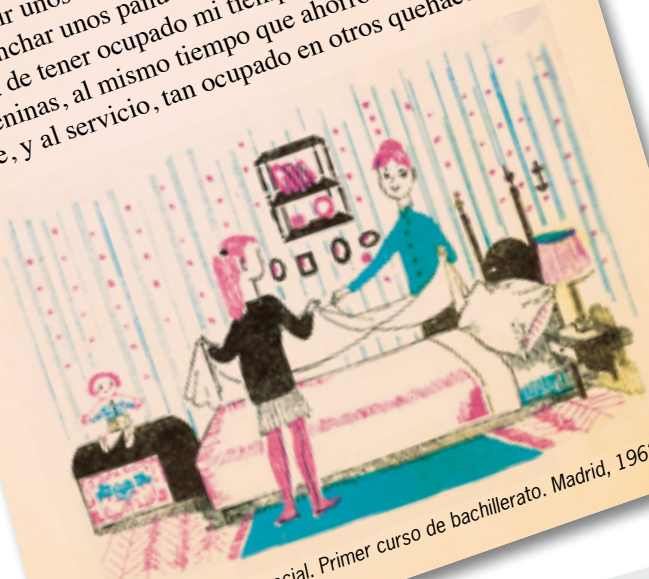
Formación Político social. Primer curso de bachillerato. Madrid, 1962