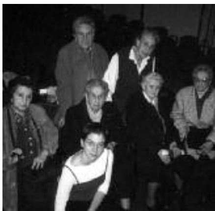
Taula rodona a l'espai Pere Pruna (febrer 2001)

La curiositat que desperten entre el públic les Dones del 36, ha provocat que 14 programes de televisió, entre ells Vides Exemplars de TV3 (amb una audiència de 824.000 persones), i 19 programes de ràdio, hagin sol·licitat la seva presència. A més, han visitat 95 instituts de secundària, 20 universitats, i han protagonitzat més de 81 actes públics. Tot plegat fa que unes 14.000 persones hagin escoltat les seves veus. Aquestes xifres augmentaran, ja que les Dones del 36 acaben de publicar un llibre, de títol homònim, amb les seves experiències, i han coprotagonitzat La Guerra Cotidiana un documental que immortalitza les seves vides.