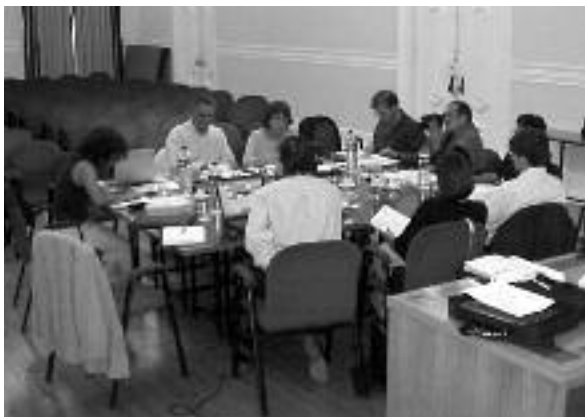
Reunió dels responsables del projecte a la ciutat de Faro

Molfetta Les dones han estat les grans protagonistes, mitjançant l'autoocupació en forma de creació de comerços en el nucli històric de la ciutat