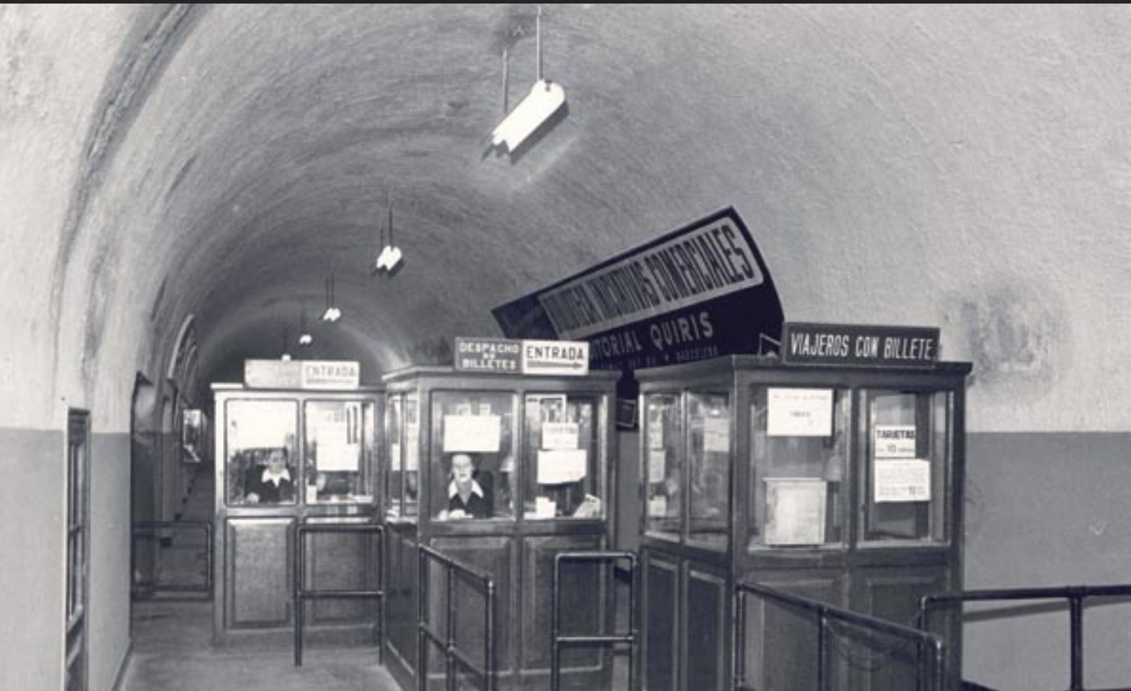
Pati de taquilles de l'estació de Correus any 1955.