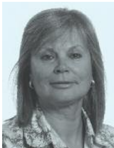
Edite Estrela, ponent de la Comissió de Drets de la Dona i Igualtat de Gènere del Parlament Europeu

La veritable dificultat es genera en l'àmbit familiar on, encara avui, les dones segueixen realitzant "la doble jornada"