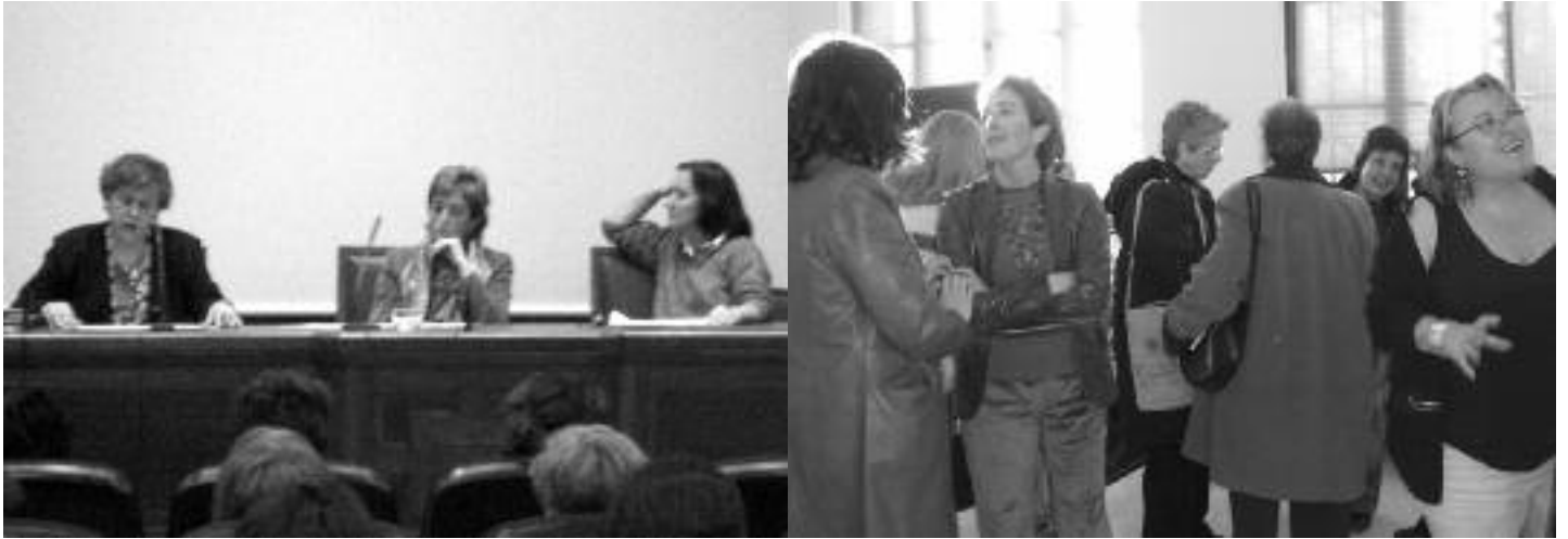
Sessions del Congrés Los feminismos como herramienta de cambio social , organitzat per l'Asociación Universitaria de Estudios de la Mujer (AUDEM)