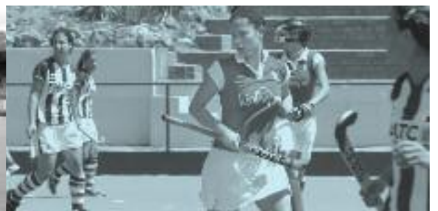
Semifinal del playoff pel títol de lliga nacional 2004-2005