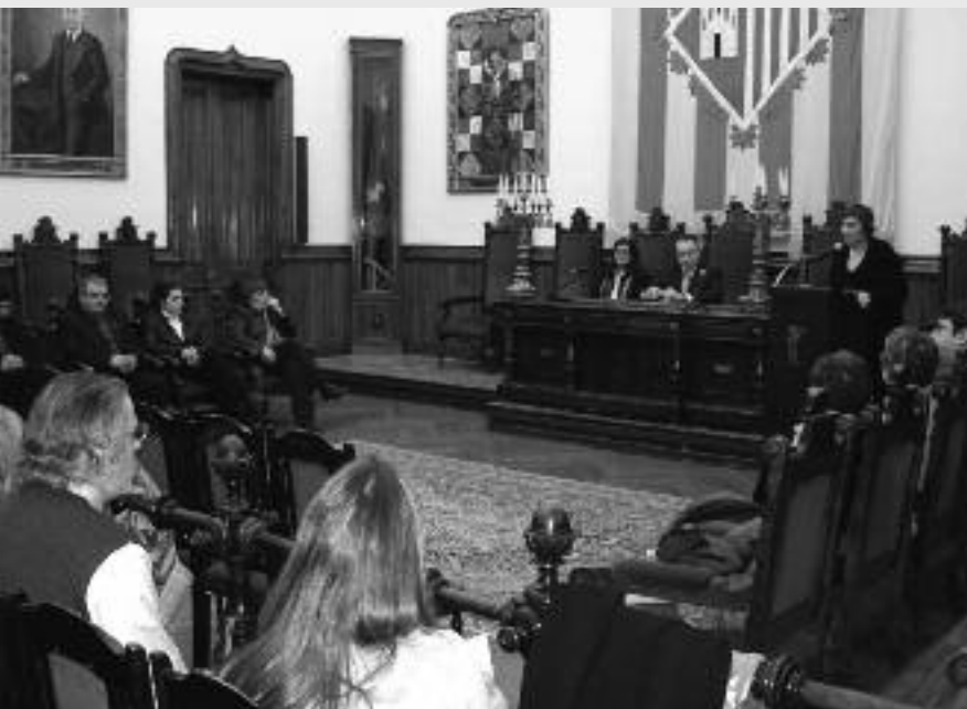
Acte inaugural de l'Escola en perspectiva de Gènere de Terrassa