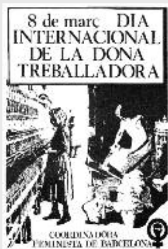
Cartell del 8 de març de 1979

És per tot això últim que crec que hem de fer una reflexió i tornar a omplir el 8 de març de reivindicació i denúncia. Tampoc cal convertir-lo en un dia de laments sinó manifestar clarament que no volem renunciar a res i que volem continuar avançant i que aquest avenç volem que sigui tant per les dones que estem en els països, anomenats desenvolupats com per a aquelles companyes que estan en els països més desfavorits o dits països empobrits. ■