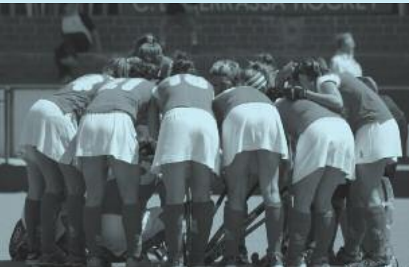
L'equip reunit just abans de començar el partit