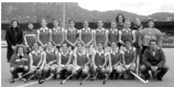
L'equip va ser campió de la lliga nacional de l'any 2004-2005

Poc, molt poc per a tanta dedicació. "Entenem que no portem a un pavelló a nou o deu mil persones, però estem en el lloc més alt, i sense perdre cap any la categoria.