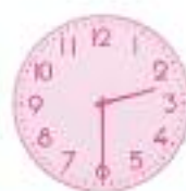
SANT POL DE MAR