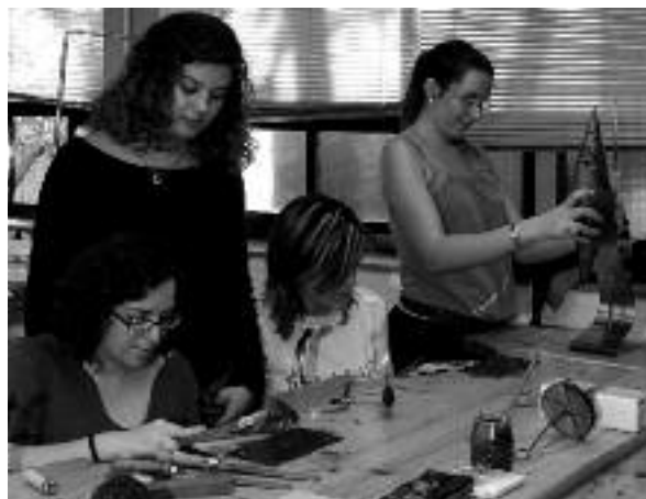
Alumnes d'orfebreria de l'Escola d'Arts i Oficis. Escola del Treball de la Diputació de Barcelona