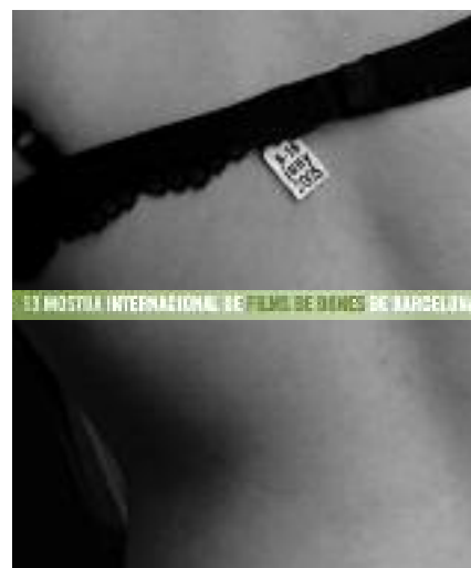
13 MOSTRA INTERNACIONAL DE CINEMA DE DONES DE BARCELONA

-com deien les organitzadores de la Mostra Internacional de Cinema de Dones quan complia 10 anys- "nomena amb utilitats propis tot el que anteriorment la institució cinematogràfica havia nomenat només des de les resolucions del llenguatge patriarcal, mitjançant els seus mecanismes habituals: el voyeurisme, la fetitxització, la prioritització de l'acció i les gestes de l'heroi". Aquest any, la Mostra Internacional de Cinema de Dones de Barcelona compleix 13 anys oferint aquesta altra mirada que posa en joc les plurals subjectivitats de les dones, que no de la dona. Del 6 al 16 de juny al cinema Verdi Park i a la Filmoteca de la Generalitat, la Mostra ens torna a portar les mirades diverses de les cineastes contemporànies de tot arreu en la secció Panoràmica, amb pel·lícules de rigorosa estrena tant documentals com de ficció. Coherents amb els seus objectius, les organitzadores de la Mostra continuen rescatant el treball de les Pioneres. Especialment suggeridora serà la projecció dels documentals que Helena Lumberas del Col·lectiu Cinema de Classe va filmar sobre el moviment obrer durant el franquisme. No us perdeu la inauguració a la Plaça de la Virreina el dia 9. Perquè fan falta totes les veus i totes les mirades.