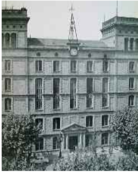
Escola industrial. Façana principal