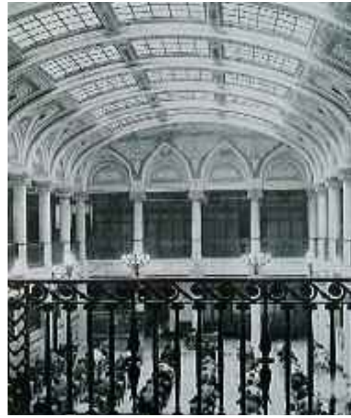
Escola industrial. Hall Central