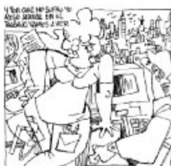
ALBERT ARIAS/EL DIARI ABC EL 15 DE FEBRER DE 2000

Una de les conclusions de l'estudi assenyala que aquest problema s'inscriu en una trama de relacions on existeix un desequi-