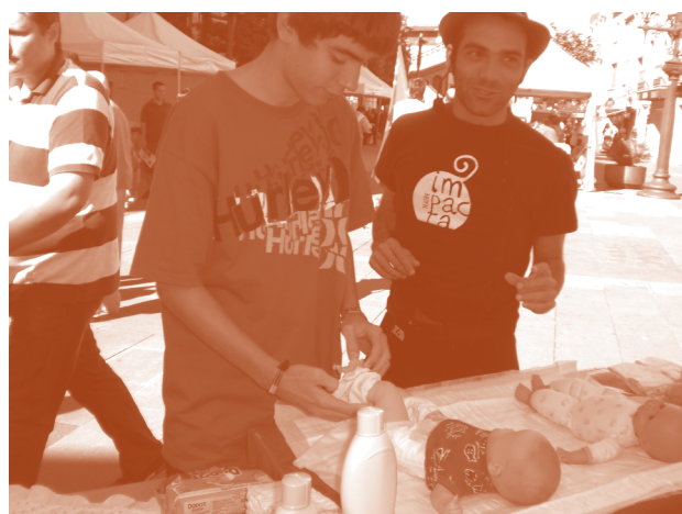
Taller de canviar bolquers per als homes en el marc de la Fira d'Entitats per la Igualtat celebrada el 25 de setembre al Raval de Montserrat.