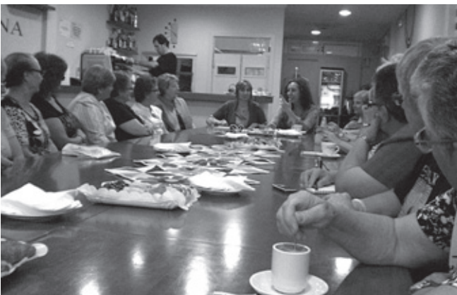
Trobada de grups de dones de Terrassa amb l'antropòloga Marcela Lagarde el passat mes d'octubre.

En aquests sentit, des de la regidoria de Polítiques de Gènere i amb la participació de les associacions i entitats de dones la ciutat, ens plantegem poder treballar en un futur, una possible Carta dels Drets de les dones de la ciutat de Terrassa.