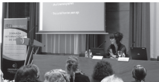
Conferència inaugural "La representació de les dones en els mitjans de comunicació: N'hi ha per empenyar-se?" a càrrec de Rosalind Gill.