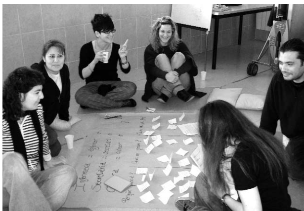
Jornada de presentació del Pla. Reunió de treball

La implementació del Pla serà revisada periòdicament per la comissió d'igualtat a partir d'un sistema d'avaluació que permeti corregir desviacions o modificar actuacions.