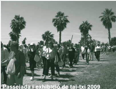
Passejada i exhibició de tai-txi 2009

Lloc: Can Massallera, c. Mallorca, 30 de 9h a 14h