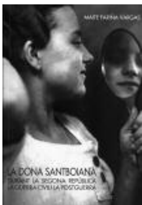
Portada del llibre.